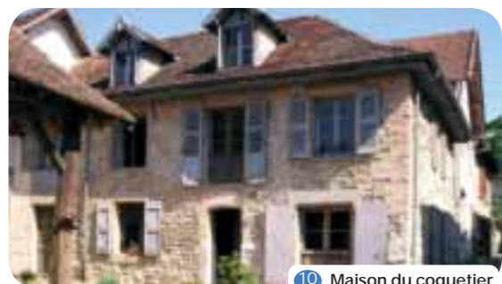
10 Maison du coquetier