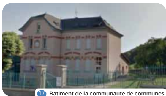
17 Bâtiment de la communauté de communes