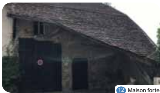
12 Maison forte