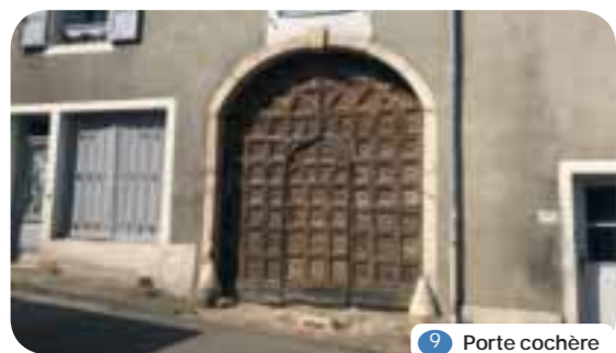
9 Porte cochère