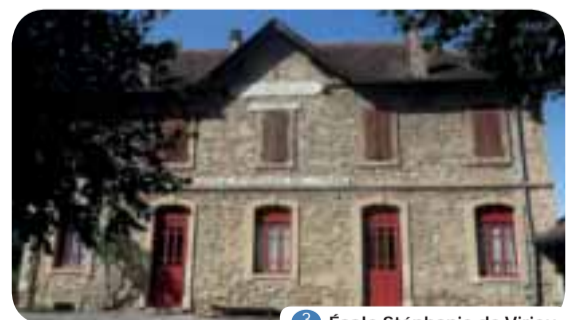
3 École Stéphanie de Virieu