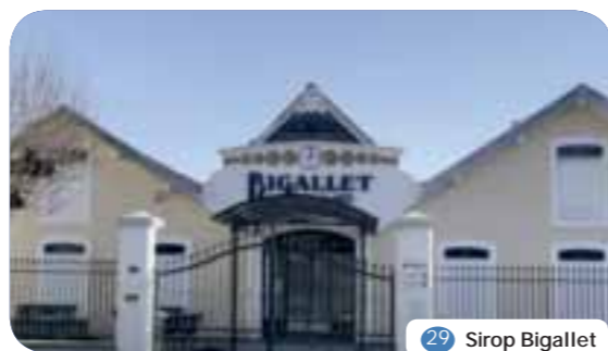
29 Sirop Bigallet