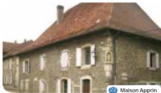
22 Maison Apprin