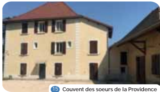
15 Couvent des soeurs de la Providence