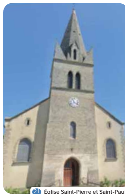
21 Eglise Saint-Pierre et Saint-Paul