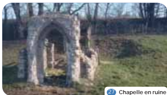
27 Chapelle en ruine