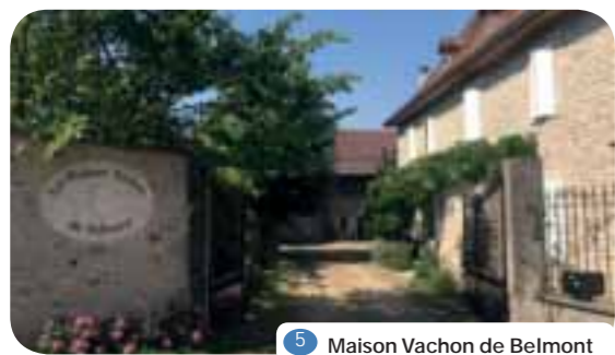
5 Maison Vachon de Belmont