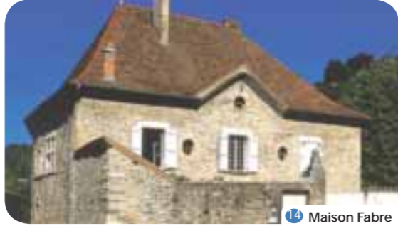
14 Maison Fabre