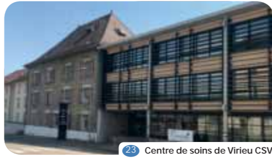
23 Centre de soins de Virieu CSV