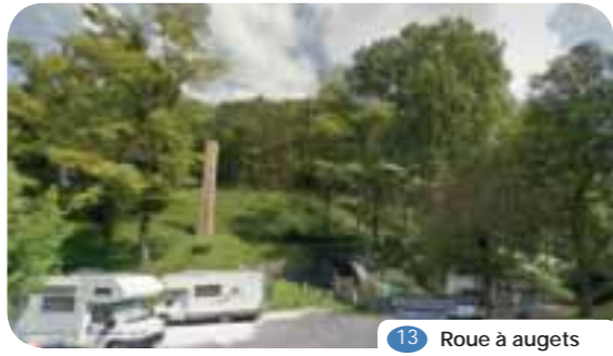
13 Roue à augets