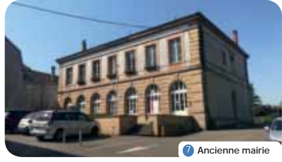
7 Ancienne mairie