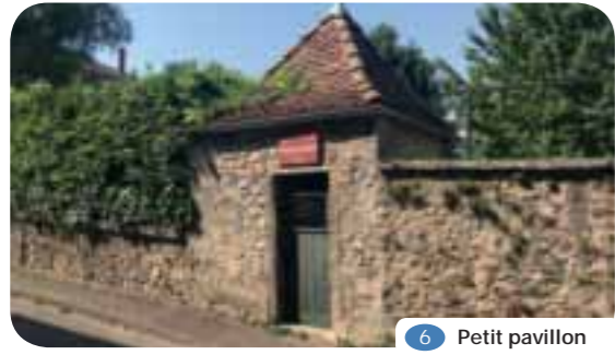
6 Petit pavillon