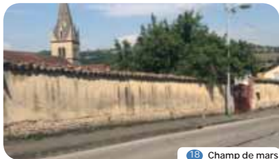
18 Champ de mars