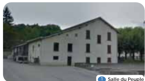
1 Salle du Peuple