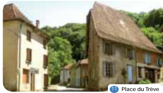
11 Place du Trève