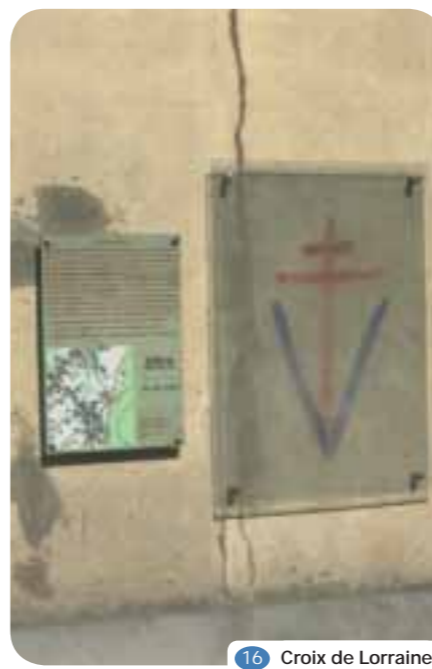
16 Croix de Lorraine