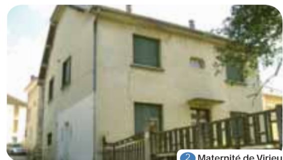
2 Maternité de Virieu