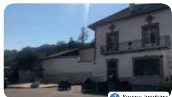
4 Square Jongking