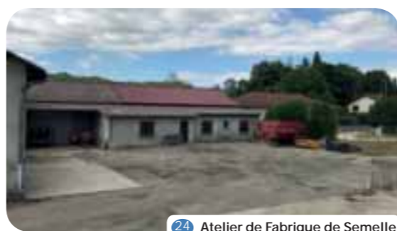
24 Atelier de Fabrique de Semelle